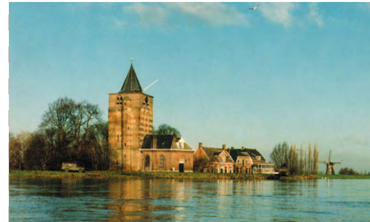
Hoog water in de Waal in 1995 met de Dikke Toren

De Heesseltsche uiterwaarden liggen in het rivierengebied tussen de dorpen Heesselt en Opijnen in de gemeente West Betuwe. Dit gebied is overloopgebied van de Waal. Bij hoog water kan het dus voorkomen dat je er maar deels of zelfs helemaal niet in kunt. De Heesseltsche uiterwaarden zijn van 2016 tot 2019 opnieuw ingericht voor het project Ruimte voor de Rivieren. Het is een natuurgebied met waterpartijen met verschillende dieptes,