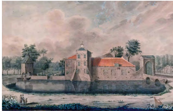
Oude aquarel uit 1777 van het Huys Varick