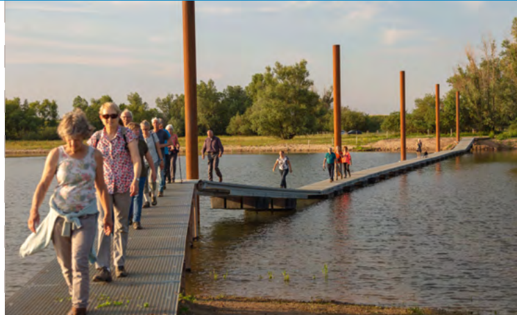
De drijfbrug over een nevengeul van de Waal