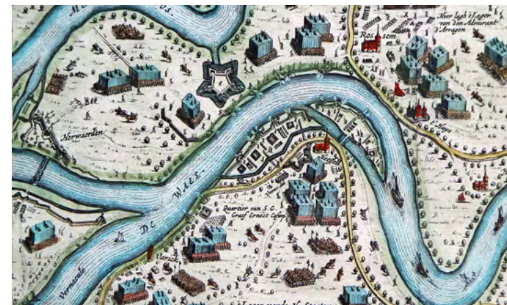
Kaart van Johannes Bleau uit 1599. Het noorden is beneden.

Tijdens de Tachtigjarige Oorlog lag het leger van Maurits in 1599 hier aan de Waal. Aan de overkant lagen de Spanjaarden bij fort Sint Andries. Maurits liet zelfs een nevengeul graven om de schepen veilig door te laten varen: het Nassaukanaal. Ook liet hij bij Heerewaarden tegenover Varik het fort Voorne (ook fort Nassau genoemd) bouwen om zo de Spanjaarden verder weg te drijven en fort Sint Andries in beslag te nemen. Langs de Waal werden reduyten gebouwd om de Spanjaarden in de gaten te houden. Reduyten of redouten waren een soort wachttorens. Er is helaas niet veel meer te zien van de nevengeul, fortificaties en andere bouwwerken.