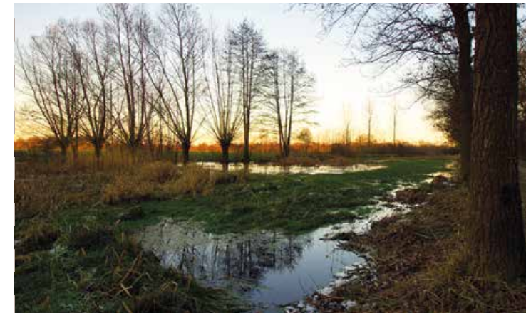
Meer ruimte voor natuurlijke vegetatie

In 2006 heeft de bermsloot van de Kaniestraat een andere vorm gekregen. De berm aan de noordkant is breder geworden waardoor er nu verschillende planten zoals dotterbloemen en kruipend zenegroen kunnen groeien. Daarmee geeft de Vereniging Natuurmonumenten meer ruimte voor een natuurlijke vegetatie. Er ontstaat een geleidelijke overgang tussen het gras en het bos. Hiervan genieten allerlei vlinders en andere insecten, maar ook ringslangen, amfibieën en andere kleine dieren zoals marterachtigen. De strook wordt jaarlijks gemaaid en het maaisel wordt afgevoerd. Een klein deel van de vegetatie blijft staan voor insecten en als schuilgelegenheid voor dieren. Door de bodem van de bermsloot te verhogen, kan het water langer in het Leusveld worden vastgehouden.