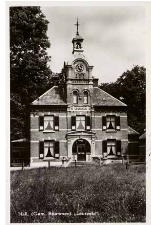
Hall, (Gem. Bommen) „Leusveld“