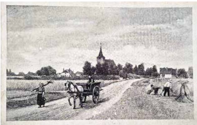
Oude ansichtkaart van het dorp Hall

met name het gebied ten noorden van de Oekense Beek overstroomde. Langs de watergang lagen schouwpaden. Vanaf daar controleerde de markerichter, de voorzitter van de marke, of grondgebruikers aan de onderhoudsverplichting hadden voldaan.