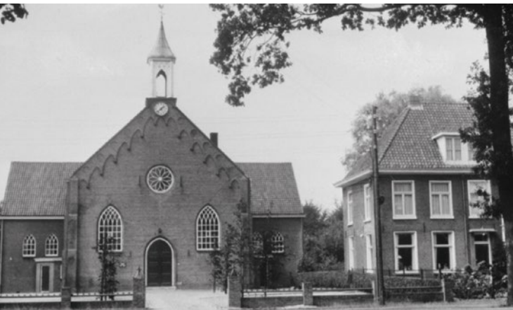
Kerk en pastorie Hierden

Voor de bouw van de huidige kerk stond op het terrein erachter een kerk uit 1741. Die kerk ontstond uit de school die hier stond sinds 1658, en waar sinds 1659 's zondags gepredikt werd. De huidige kerk stamt uit 1851, en is van oorsprong een hallenkerk met tongewelven. Vroeger werd het terrein van de kerk omsloten door een gracht. In 1937 werd een houten plafond aangebracht en zijn vleugels aangebouwd zodat een zogenaamde kruiskerk ontstond. In 2001 is de kerk geheel gerestaureerd.