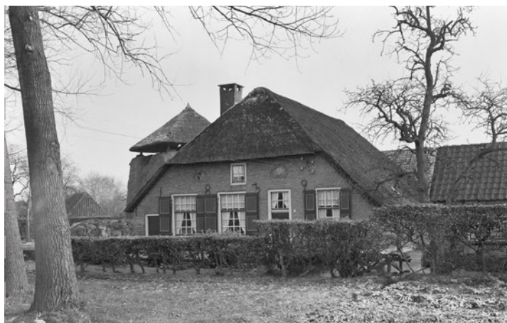
Boerderij aan Rijkstraatweg 130, circa 1965