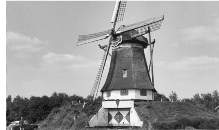
De Gerardamolen in Heijen (Limburg) in 1966

De molen is gebouwd in 1850 en bemaalde een gebied bij Heerenveen. In 1913 is de molen verplaatst naar Hierden en kreeg de naam Molen de Hoop. De molen werd in de volksmond ook wel de molen van Kisjes genoemd. In de jaren 1949-1950 is de molen wederom afgebroken en in Heijen (Limburg) herbouwd waar hij nog steeds dienst doet als korenmolen onder de naam Gerardamolen. Na diverse renovaties en een restauratie is de molen in Heijen zeker een bezoekje waard. De afgelopen jaren is in het resterende stenen onderbouw aan de Molenweg te Hierden een atelier gevestigd. In 2020 is de oude terp rond de onderbouw afgegraven.