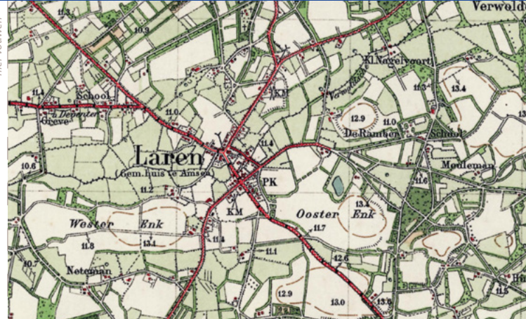
Kaart van Laren en omgeving uit 1936