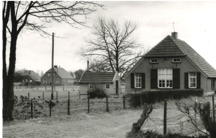
Boerderij aan de Knibbeldijk (1965)