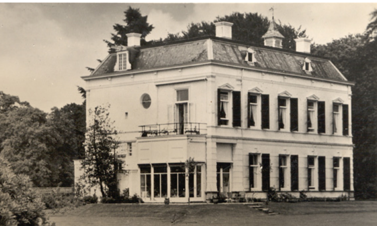
Huize 't Ross

Op de plek van huize 't Ross stond rond het jaar 1200 al een boerderij met de naam Veltcamp. Deze was eigendom van de heer van kasteel Keppel en heeft in enkele honderden jaren meerdere pachters gekend, totdat in 1697 de rijke en vooraanstaande Zutphense familie Wentholt het huis kocht. Na verschillende uitbreidingen en verbouwingen door de opeenvolgende generaties heeft het Ross de huidige vorm gekregen.