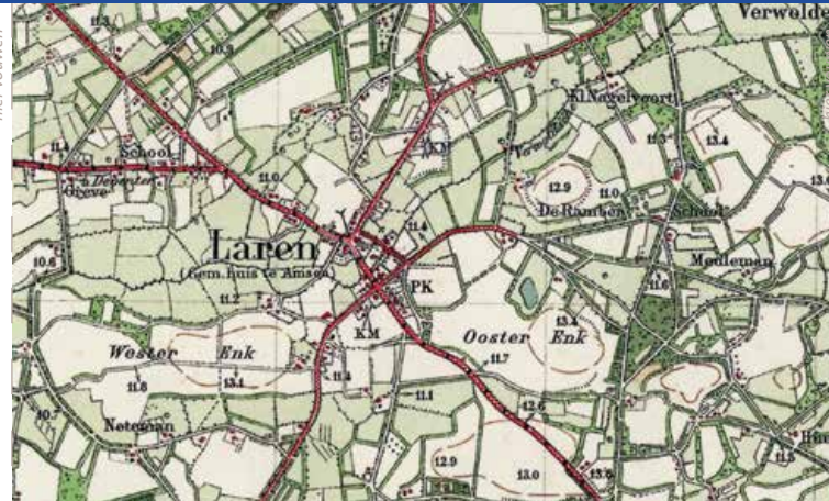
Kaart van Laren en omgeving uit 1936

In 1837 werd de Marke Groot Dochteren verdeeld; 't Ross verwierf zo'n 280 hectare, alsmede twaalf boerderijen in de directe omgeving. Het was toen in het bezit van de familie Van Rappard. In 1914 was de familie echter door geldnood gedwongen de boerderijen en bijbehorend land te verkopen en in 1919 het huis zelf met nog ongeveer zeven hectare tuin en bos.