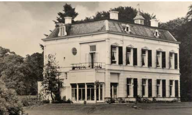
Huize 't Ross

Op de plek van huize 't Ross stond rond het jaar 1200 al een boerderij met de naam Veltcamp. Deze was eigendom van de heer van kasteel Keppel en heeft in enkele honderden jaren meerdere pachters gekend, totdat in 1697 de rijke en vooraanstaande Zutphense familie Wentholt het huis kocht. Na verschillende uitbreidingen en verbouwingen door de opeenvolgende generaties heeft het Ross de huidige vorm gekregen.