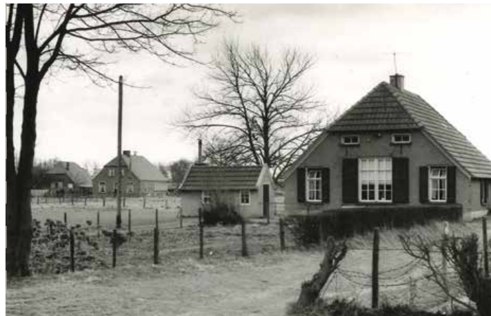
Boerderij aan de Knibbeldijk (1965)