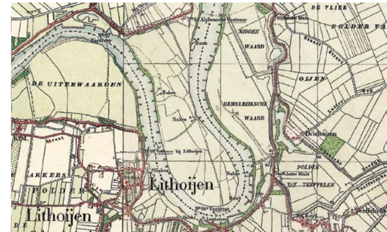
Oude kaart rond 1900 van de Maas met vier voetveren

Na de overstroming in 1926 werd in de jaren '30 gestart met de Maaskanaliseringswet, waarbij stuwen in de Maas werden aangelegd om het waterpeil beter te beheersen en ook in de zomer scheepvaart mogelijk te maken. Om bij hoog water een snellere afvoer van regenwater mogelijk te maken werden talrijke Maasmeanders afgesneden. De stuw tussen Alphen en Lith is gebouwd in een bouwput in de uiterwaarden bij Lith. Daarna werd de loop van de rivier verlegd naar de nieuwgebouwde stuw. De stuw bij Lith is de laatste voor de rivier de zee bereikt.