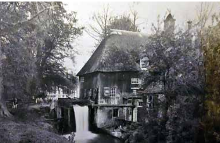
Historische foto Cannenburchermolen

Dit Klompenpad is tot stand gekomen onder coördinatie van Stichting Landschapsbeheer Gelderland in samenwerking met vele vrijwilligers, de gemeente Epe, Kroondomein Het Loo en andere partijen uit de streek. Klompenpaden zijn cultuurhistorische wandelroutes die particuliere terreinen, zoals landgoederen en boerenland, toegankelijk maken voor de wandelaar. Ze gaan zoveel mogelijk over historisch tracé en onverharde paden. Rust, kleinschaligheid en de combinatie van cultuur en natuur bepalen de sfeer en vertellen bewoners en wandelaars over de geschiedenis van hun omgeving. Ook het landschap heeft voordeel van de ontwikkeling van Klompenpaden: vaak worden landschapselementen hersteld en aangelegd. Door aan te sluiten bij lokale initiatieven als landwinkels, horeca en kamperen bij de boer wordt de economie van de streek versterkt.