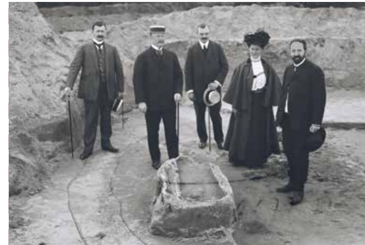
Prins Hendrik bij opgravingen de Hertenkamp, 1909

Alhoewel het Klompenpad slechts langs een beperkt aantal grafheuvels voert, zijn er een groot aantal in de omgeving. Van buurtschap Niersen loopt zelfs een grafheuvellijn van meerdere kilometers in de richting van Epe. Deze liggen waarschijnlijk langs een eerdere route. Er zijn grafheuvels in verschillende soorten en maten. Langs de route liggen een aantal urnenheuvels. Deze zijn gemaakt in tijden dat het stoffelijk overschot werd gecremeerd en de resten in een urn in een kleinere heuvel werden begraven. Meer naar het westen zijn de grafheuvels aanmerkelijk groter en ouder. Daarin werd het stoffelijk overschot van de overledenen in het centrum ervan begraven. In een aantal gevallen werden later opnieuw overledenen begraven aan de rand van de grafheuvel.