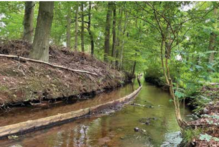
Het schot tussen de Nieuwe beek en de Rode beek

de Rode beek) door een schot gescheiden door een bedding stromen, terwijl aan de andere kant de Hartense molenbeek stroomt. Om nog meer water richting de Cannenburch te krijgen werd ook een derde van het water van de wat zuidelijker gelegen Geelmolense beek naar dit stroomgebied geleid. De beken zijn vandaag de dag belangrijk om hun cultuurhistorie, de rijke planten- en dierenwereld in en langs de beken en de landschappelijke en recreatieve waarde.