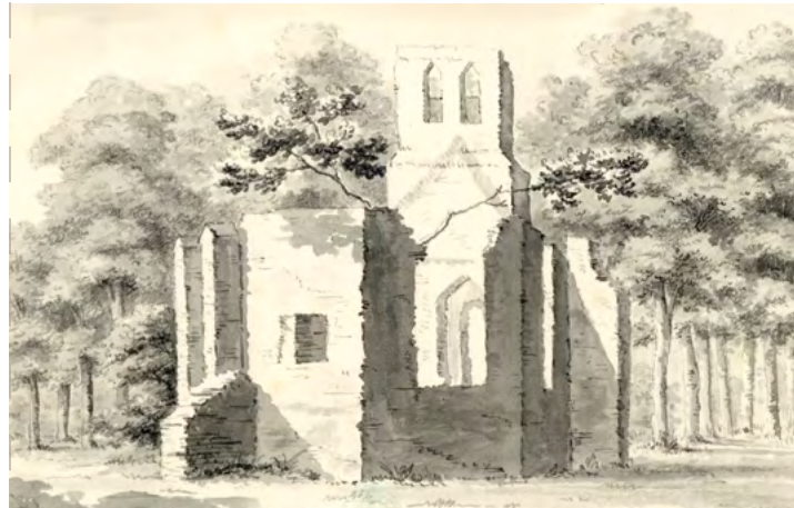
Gezicht op de ruïne van de kapel van het dorp Darthuizen, Louis Philip Serrurier, ca. 1731