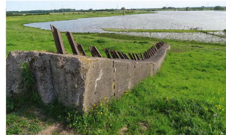
Overgebleven tankversperring aan de Leuvensedijk

Wandelend over de Leuvensedijk heeft men goed zicht op de Jezuïtenwaai, een eldorado voor watervogels. Sinds enkele jaren laat de lepelaar zich hier ook zien. Als familie van de ibis is deze vogel herkenbaar aan zijn lange zwarte snavel die een lepel vormt. De lepel heeft een opvallende gele kleur. Het verendek is overwegend wit met boven op de kop een kuif. In het water foerageert hij door het heen en weer bewegen van de snavel. Het voedsel bestaat hoofdzakelijk uit visjes, waterdieren, slakken, bloedzuigers, insecten en wormen. Broeden gebeurt bij voorkeur in kolonies, vaak in oobossen langs rivieren. Vliegen doen lepelaars met gestrekte hals, zilverreigers trekken hun hals in. Lepelaars zijn alleen in de zomermaanden hier te zien. Om te overwinteren vliegen deze vogels naar Afrika.