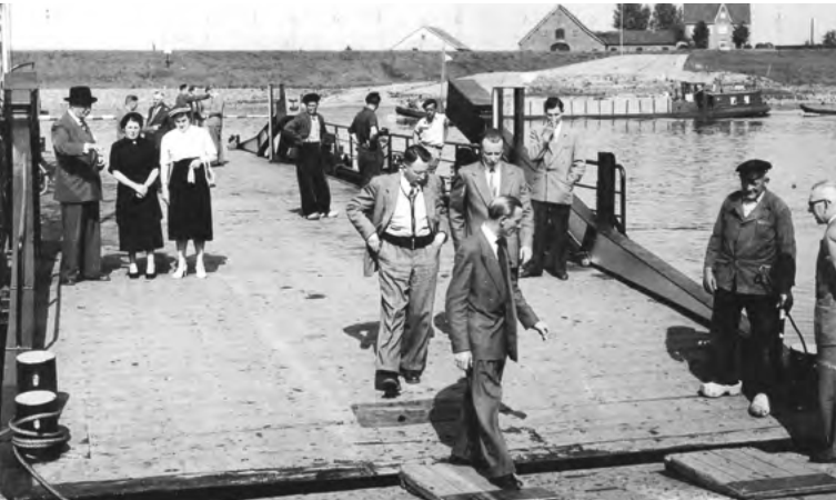
Eerste passagiers tijdens inauguratie van een nieuwe gierpont in 1954

Hoewel niets hier meer aan herinnert, lagen langs de rivier tussen midden 19e eeuw en de crisisjaren rond 1930 een drietal scheepswerven. Het begon met de bouw van houten schepen met een tiental timmerlieden. Later begonnen enkele uit Groningen afkomstige broers nog 2 scheepswerven dit keer voor ijzeren schepen. Op deze werven werkten in hoogtijdagen 60 arbeiders plus zo'n 8 zogenaamde nageljongens. Voor deze jongeren bestonden de werkzaamheden voornamelijk uit het verhitten van de klinknagels.