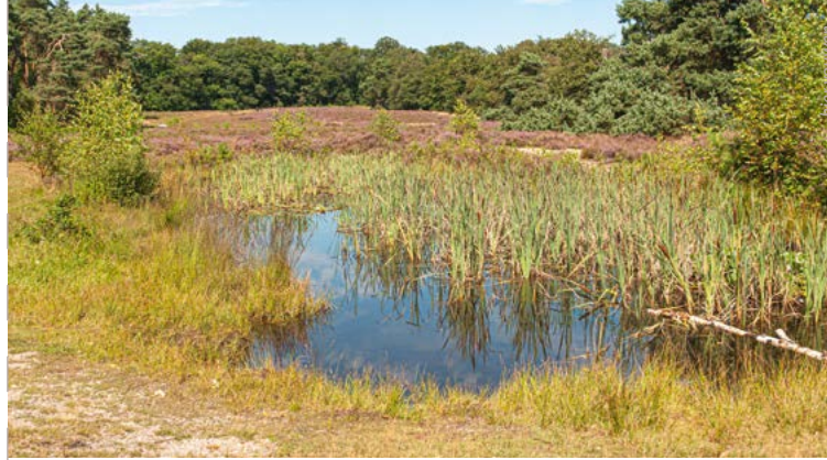
Schaapsdrift met heideven