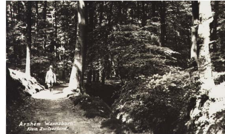
Arnhem, Warnsborn, Klein Zwitserland.