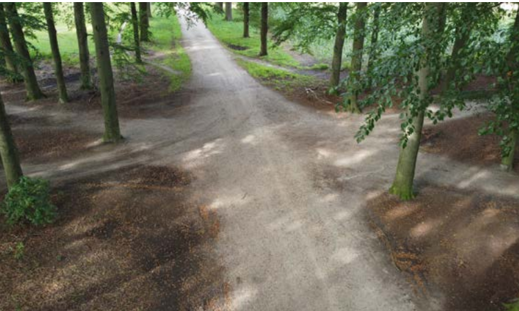
Zessprong Hoog Erf

toen leefden, hun doden bijzetten in uitgeholde boomstammen. De grootste grafheuvel van Noordwest-Europa staat ook wel bekend als de Meelworstenberg, naar het favoriete middageten van de archeologische opgravers: boekweitmeel gekookt in een darm.