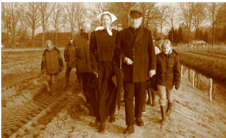
Vroegere bewoners op het kerkenpad