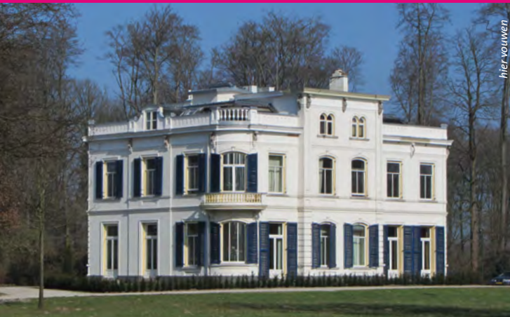
Landhuis De Boom nu