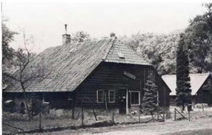
Hoeve Beekhuizen (datering onbekend)