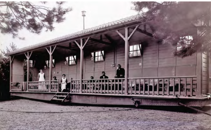
Draaibare lighallen Sonnevanc, circa 1910

Verspreid over het terrein, te midden van het groen, stonden houten lighallen voor patiënten waarvan de voorkant open was. Die hallen stonden op wielen waardoor de hele constructie, met patiënten en al, met de zon mee kon draaien. Helaas zijn alle hallen afgebroken. Naast de kapel staat een sterk verkleinde replica. Honderden longpatiënten uit het hele land werden hier verpleegd. Velen stierven, vaak heel jong zoals op de begraafplaats te zien is. Er was geen medicijn tegen tbc. Tegenwoordig is het terrein in gebruik als verzorgingstehuis met alle mogelijke faciliteiten. Ook bevindt zich een hospice op Sonnevanc.