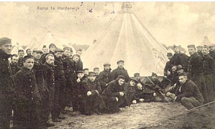
Militair kamp op het Beekhuizerzand, circa 1910

Deze kapel dateert uit 1961. Het gebouw is ontworpen als een multifunctionele ruimte en daarmee een atypisch kerkgebouw. Het is zowel een kapel als recreatieruimte. De enorme raampartij verbindt binnen met buiten, de natuur, een streven dat op Sonnevank vanaf de oprichting in 1908 van groot belang is geweest voor de patiënten. Aan de achterzijde bevindt zich een bijzonder, en in Nederland zeldzaam, glas-in-beton raam, materiaal dat typisch is voor de bouwstijl van de wederopbouwperiode en het Functionalisme.