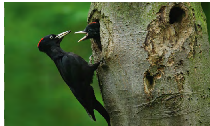
Zwarte specht met jong

De zwarte specht komt in deze bossen voor en is behoorlijk schuw. Deze grote spechtsoort maakt nesten in dikke loofbomen. Als zo'n nest niet meer wordt gebruikt, biedt het een geschikte holte voor bosuil, boommarter en vele andere diersoorten. Zodra de vogel een mens ziet, vliegen ze snel weg of verstoppen zich aan de andere kant van de boom.