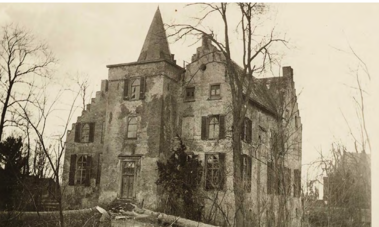
Kasteel Wijenburg voor de restauratie

De kerk van Echteld -in Romaanse bouwstijl- dateert uit de 11e eeuw, de oude tufstenen zuidmuur is nog uit deze tijd. Het koor is in de 14e eeuw aangebouwd. Oorspronkelijk was de kerk nog acht meter langer. De toren is rond 1835 ingestort en kort daarna vervangen door een nieuwe die in het oude schip staat. In de kerk zijn prachtige 'secco' muurschilderingen te zien die het laatste oordeel en Sint Joris en de draak voorstellen. Ook is er een praalgraf van Reinout van Wijhe. Op het kerkhof staan zogenaamde 'pesthuisjes' waarin vroeger zieke mensen tot hun dood werden verzorgd. Wekelijks worden er in de kerk nog protestantse erediensten gehouden.