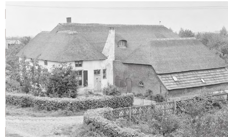
Hallenhuisboerderij Den IJver

Langs de Waalbandijk ligt een aantal karakteristieke hallenhuisboerderijen. 'Den IJver' aan Waalbandijk met een dwars voorhuis is een mooi voorbeeld hiervan. Deze heeft een 18de-eeuwse oorsprong, maar een achterhuis uit 1877. Een relatief jonge hallenhuisboerderij uit circa 1920 is te vinden aan de Ooiststraat.