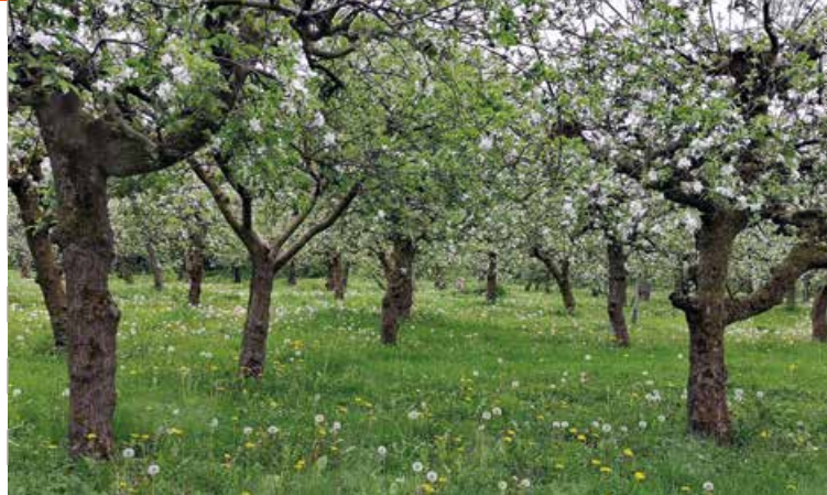
Hoogstamboomgaard Bellefleur in bloei

nen de bewoners hebben bewogen deze natuurlijke hoogte in stappen verder op te hogen. Op het terrein van Fruitbedrijf en Landwinkel De Woerd staat een grondwatermeter. Voor een fruitteler is het ideale als het grondwater 80 tot 120 centimeter onder het grondoppervlak staat. De grond is dan droog genoeg om met de machines de boomgaard te onderhouden en groeien de bomen goed.