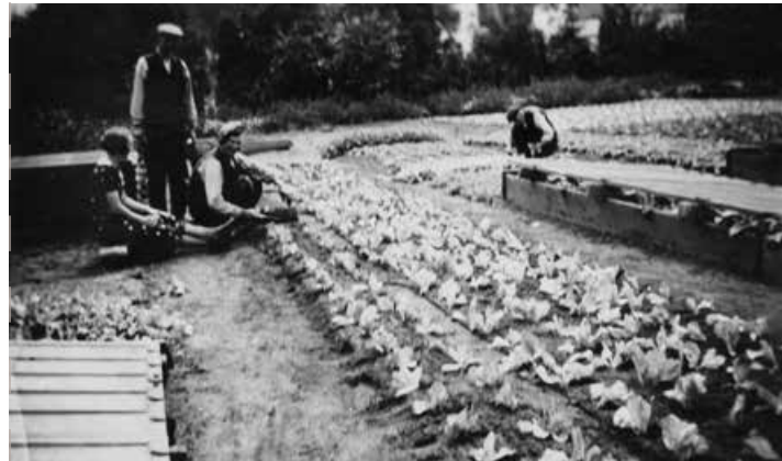
Tuinbouw in Lent, 1937